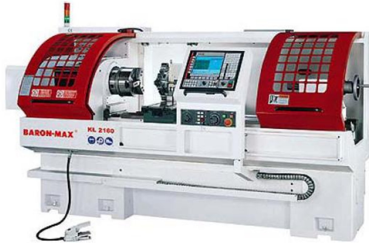
CNC-SORVI BARON-MAX KL-2100-SARJA - kuva viitteellinen