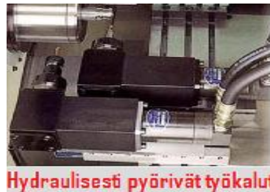
Hydraulisesti pyörivät työkalut